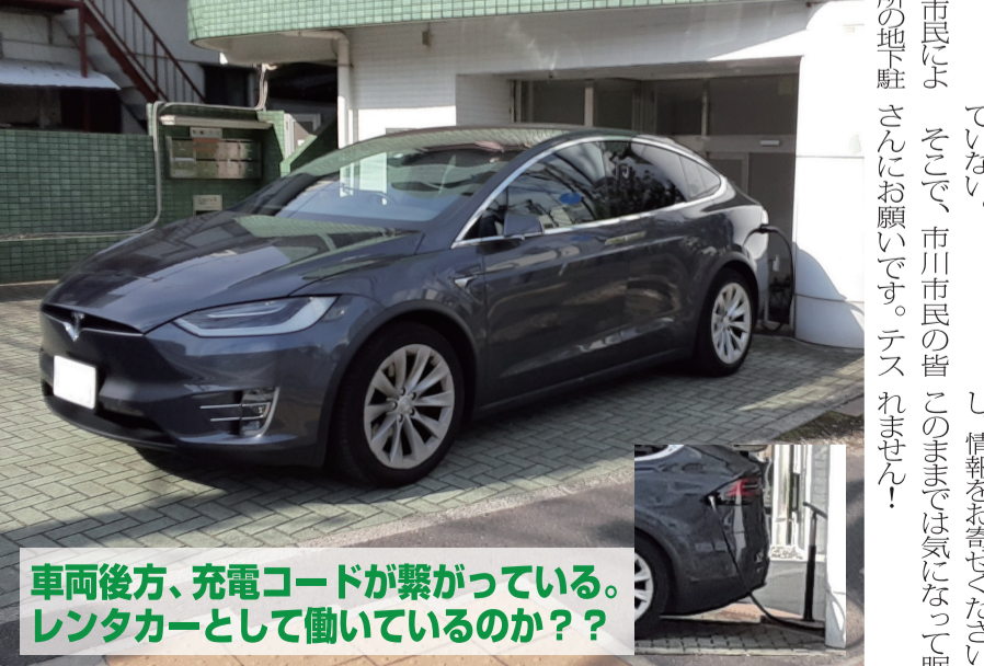
車両後方、充電コードが繋がっている。レンタカーとして働いているのか??

3月21日、任期満了に伴う千葉県知事選挙が特別定額給付金の支給をめぐって、新人8人の開票された。結果は、争いとなったが結果は、元千葉県市長の熊谷俊人氏に投票したわけ、いまま、千葉県内どこか首都圏、日本中に大きな影響力があると言っても過言ではない。 熊谷氏といえば、昨年